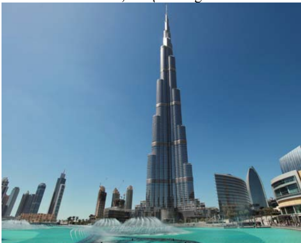
Figură 4. Turnul Burj Khalifa din Dubai, EAU.

Fundația turnului este de tip radier general pe piloți. În total sunt 194 de piloți din beton, fiecare având diametrul de 1,5 m și o lungime de 43m.