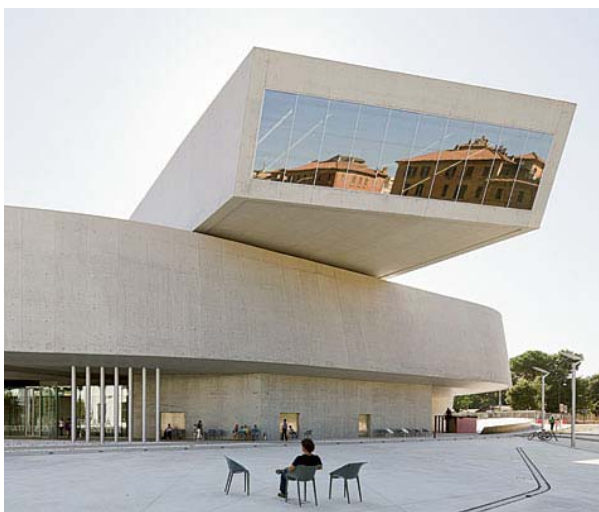
Figură 3. Muzeul Maxxi din Roma, Italia

La punerea în operă, betonul a fost pompat prin conducte cu o presiune de până la 150 kPa, iar după decofrare, suprafața elementelor a rămas atât de netedă, încât mulți îi atribuie un aspect mătășos.