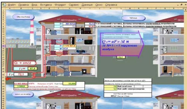
Рисунок 2. Окно программы расчета.

Для проведения таких вычислений по данным строениям на основе вышеописанной модели была разработана программа, окно с данными и контрольными результатами расчетов показано на рис 2.